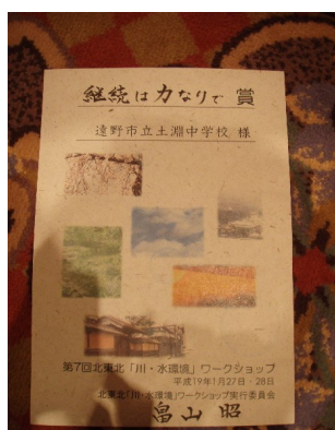
オリジナル表彰状 （北東北）