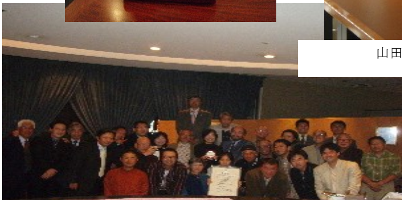
皆さんと 記念撮影