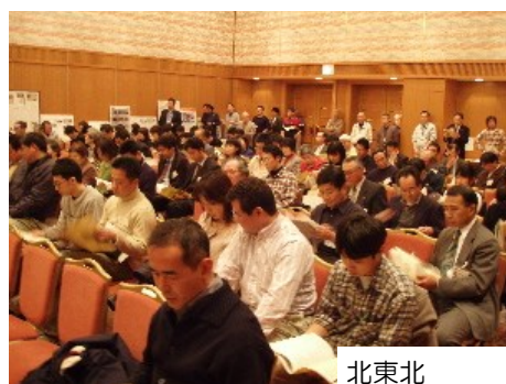
北東北 遠野市 あえりあ遠野