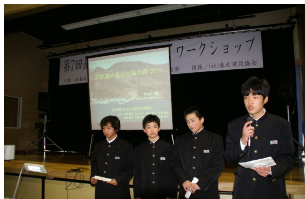
女川町立第4中学校（子どもの部グランプリ）