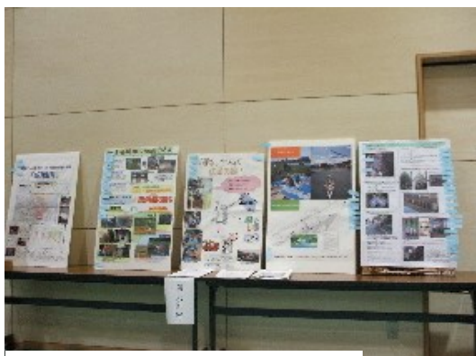
南東北 発表パネル

南東北（宮城・山形・福島） 宮城県石巻市 北上総合支所 2007年2月24日・25日