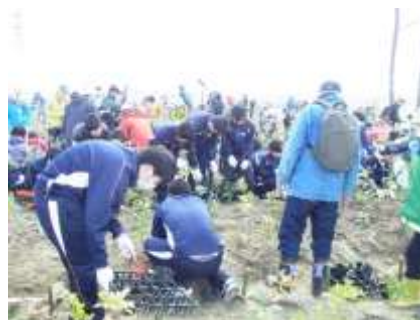
▲防潮堤への植林作業（岩沼市）