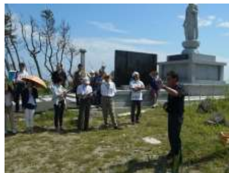
▲エクスカーション