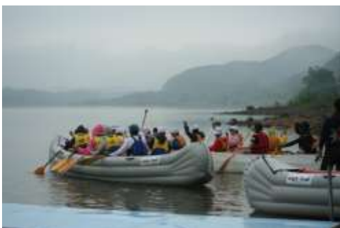
▲大型カヌー（E ボート）体験