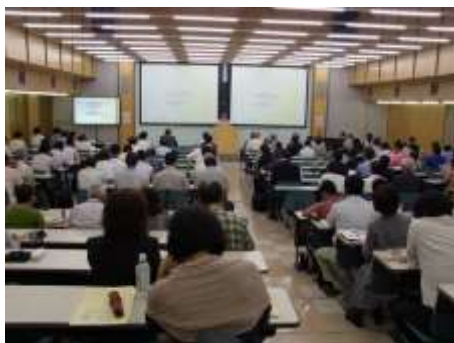
▲雨水ネットワーク会議全国大会