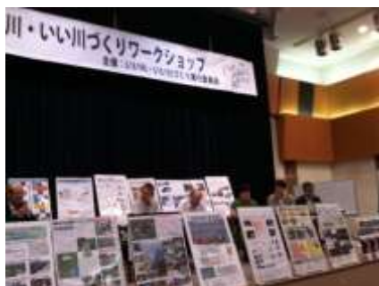
▲「いい川・いい川づくりワークショップ（東京）」

NPO 法人全国水環境交流会 NPO 法人水の旅人 NPO 法人北上川流域連携交流会 公益社団法人日本河川協会 をんな川会議 浄化槽フォーラム （仮称）建設系 NPO 連絡協議会 杜の都の市民環境教育・学習推進会議 海洋ニュービジネス研究部会（略称 マリン部会） 貞山運河の魅力再発見協議会 いのちを守る森の防潮堤推進東北協議会