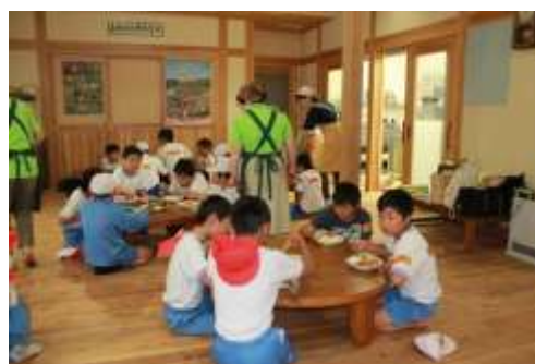
▲昼食は地元食材を使ったカレー