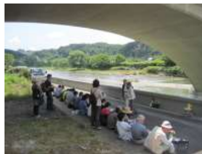
広瀬川大橋左岸で河川清掃後、四ツ谷用水についての講座。