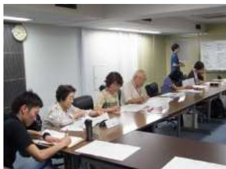
▲環境フォーラムせんだい実行委員会