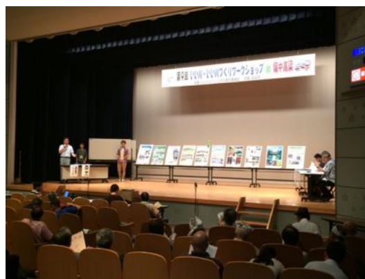
▲いい川・いい川づくりワークショップ in 高梁(2016.9.9-11)