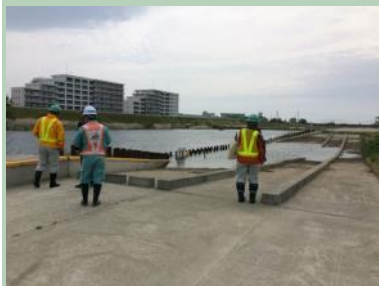
▲じゃぶじゃぶ池の点検。 (八本松 2016.4.18)

名取川水系 名取川・広瀬川 国(東北地 整備局)第42号 (指定 平成27年3月2日)