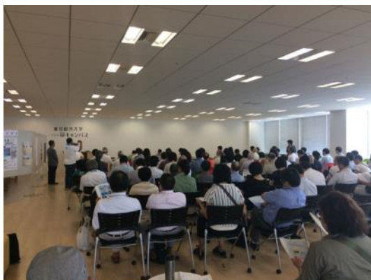
▲雨水ネットワーク全国大会2016 in 東京(2016.8.5-7)