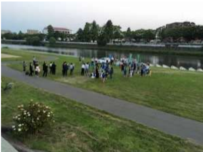
「水辺で乾杯」広瀬川宮沢橋(2017.7.7)