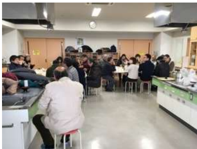
木町通市民センター