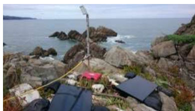
石巻尾崎の太陽光パネル

プロジェクトの終了に伴い、ホームページでの告知・整理等を行いました。 また、つながり・ぬくもりプロジェクトで、2011年に石巻尾崎における追波湾の小島に設置したパネルの修理依頼があり、2017年9月に対応しました。