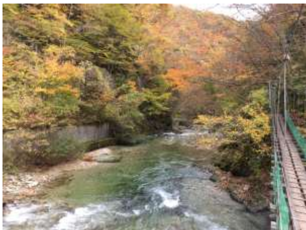
奥新川(広瀬川上流/11月)