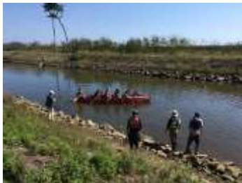
貞山運河の舟遊び(Eポート)