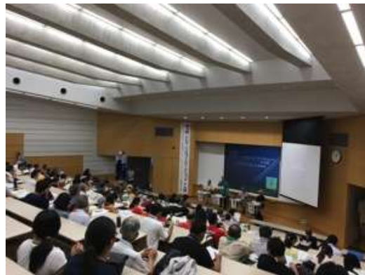
2017.9.9-10 「第10回 いい川・いい川づくりワークショップ in 九州」

いい川・いい川づくりワークショップ実行委員会 泉環境フォーラム 環境フォーラムせんだい実行委員会 2016 11/30、2017 6/28、7/27、8/28、9/28 グリーン連合地域交流会実行委員会 広瀬川1万人プロジェクト実行委員会