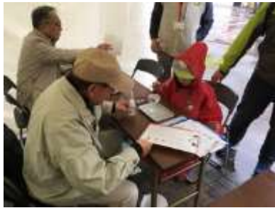
水のオリンピック

「身近な環境」をテーマに開催されているミヤギテレビ「ツルハクリーンフェスタ 2017 in 仙台」の中で、「ミニ環境教室」のブースを担当しました。(当日は雨のため短縮プログラムとなりました)