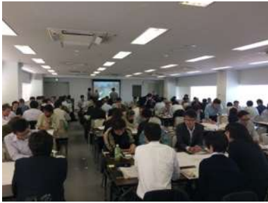
ワークショップ「川の働きを活かした多自然川づくり演習」

※研修会の中の、講座 3(14:30～16:00)の内容について企画運営を行いました。