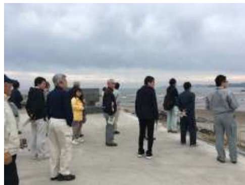
▲宮城県流域水循環計画推進会議 現地研修会 野蒜築港(2017.10.25)