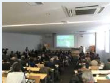
▲四ツ谷用水フォーラム(2018.2.3)