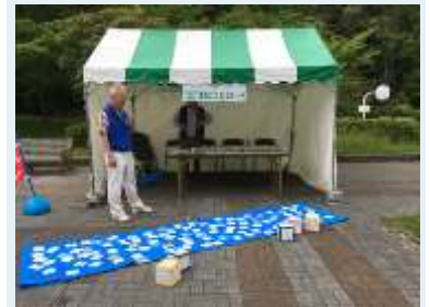
▲環境ブース 「“ゴミ”本当に『ゴミ』なの…?」 (2018.5.12)