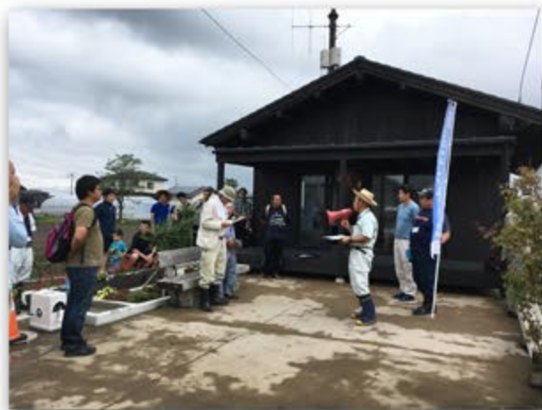
新浜みんなの家 (仙台市宮城野区岡田字浜通54の2)

【お申込】 E-mail : endoh_g@lemon.plala.or.jp または FAX : 022-762-6563