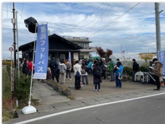
新浜みんなの家 (仙台市宮城野区岡田字浜通54の1)

【お申込】 E-mail : endoh_g@lemon.plala.or.jp または FAX : 022-762-6563