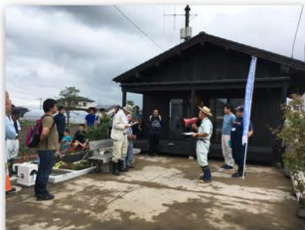
新浜みんなの家 (仙台市宮城野区岡田字浜通54の2)